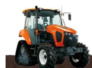
クローラータイプトラクター

作業の安定化と時間短縮、労働負担を軽減し、担い手への地域の農地集積及び集約化を推進するため、国の地域農業構造転換支援事業を活用し、大型作業機械を安定してけん引可能なトラクターの導入費用を補助します。