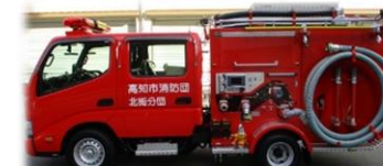
非常備消防ポンプ自動車

契約価格 30,244,130円（消費税及び地方消費税、リサイクル料金等法定費用を含む） 契約者 株式会社藤島