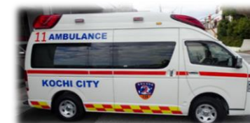
高規格救急自動車

契約価格 19,989,600円（消費税及び地方消費税、リサイクル料金等法定費用を含む） 契約者 高知トヨタ株式会社