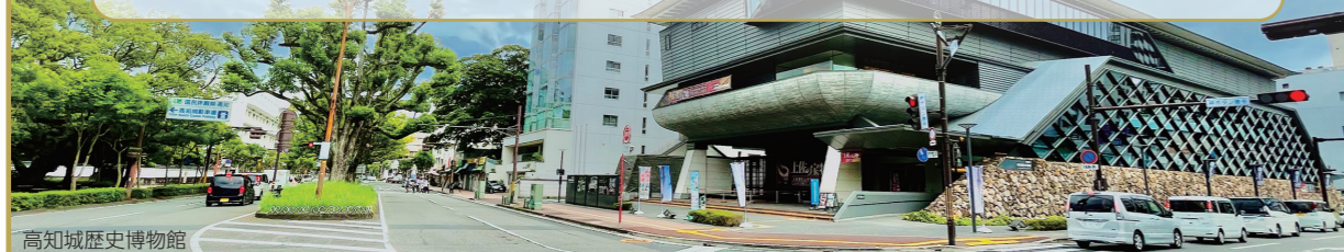
高知城歴史博物館