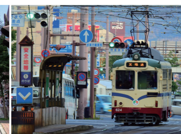
路面電車 (とさでん交通)