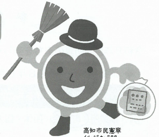
高知市民憲章 イメージキャラクター 「けんしょうくん」

日時 令和8年 6.11 木 雨天中止 午前7:30～8:10 ※ 青柳公園のみ午前7時10分～