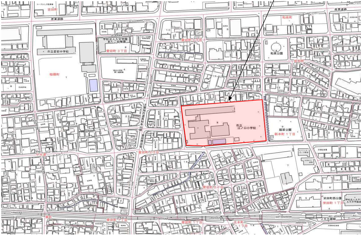
○江ノ口小学校 配置図