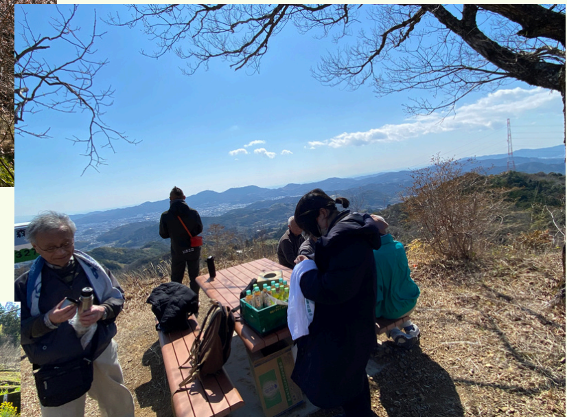
お天気も良く、海の光も見えるようでした