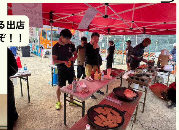
PTAによる出店 さあ焼くぞ！！