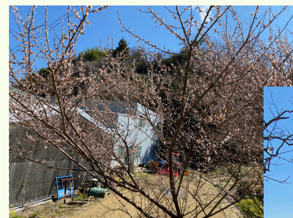
桜にはちょっと早かったのですが、花桃がとても綺麗に咲いていました。