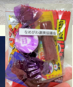
最後は全員で じゃんけん大会！！ 夏の夜に、みんなの笑顔が はじけました