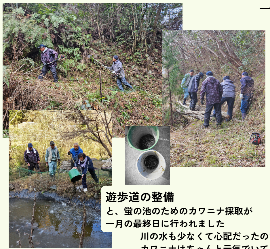
遊歩道の整備と、蛍の池のためのカワニナ採取が一月の最終日に行われました 川の水も少なくて心配だったのですがカワニナはちゃんと元気でいて放流することができました。

マラソン大会 12/12 冬休み 12/26～ 合同防災 1/17 遊歩道の整備 1/31 卒業生を送る会 2/21