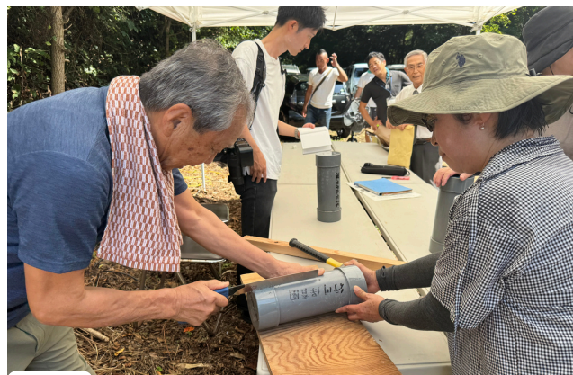
カプセルを開けるのが結構大変でした。