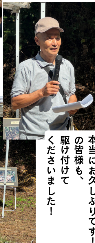
本当にお久しぶりです！の皆様も、駆け付けてくださいました！