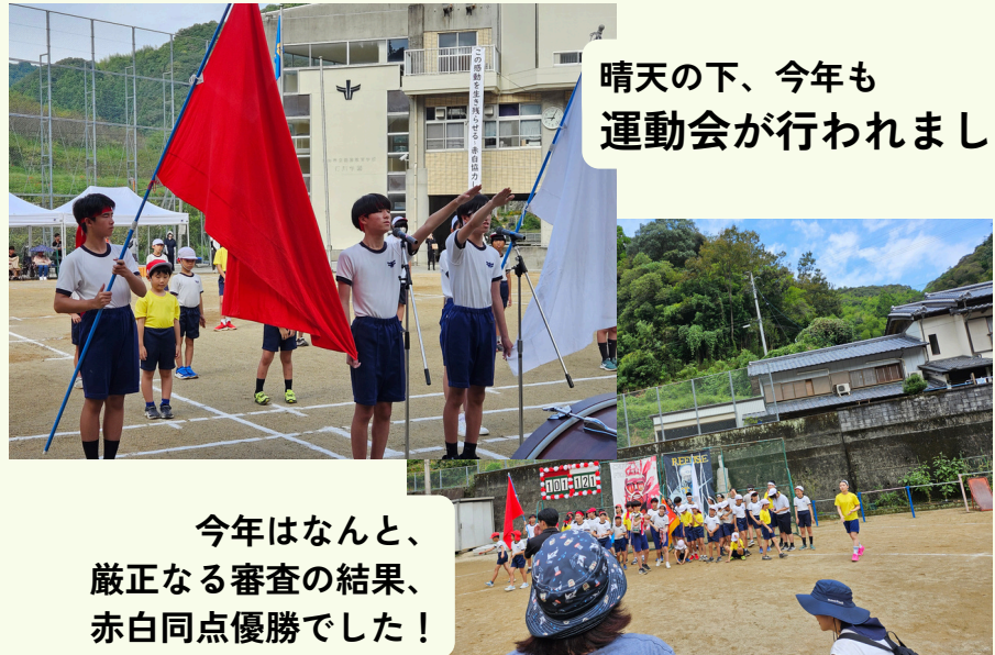
晴天の下、今年も運動会が行われました！

運動会 9/27 タイムカプセル開封式9/15 青少協Aブロック共同事業 11/9 学習発表会 11/15