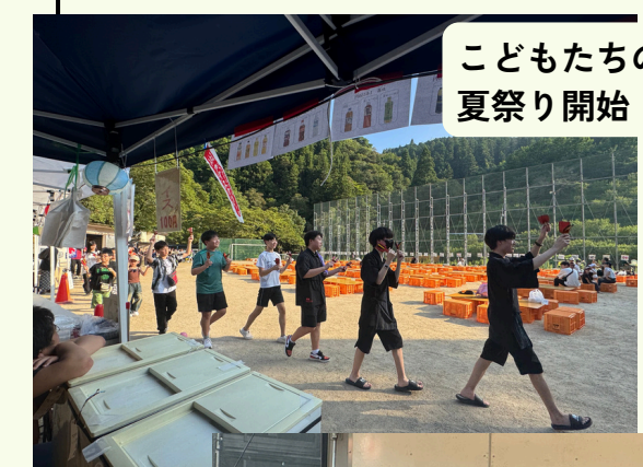
こどもたちのよさこいで夏祭り開始！