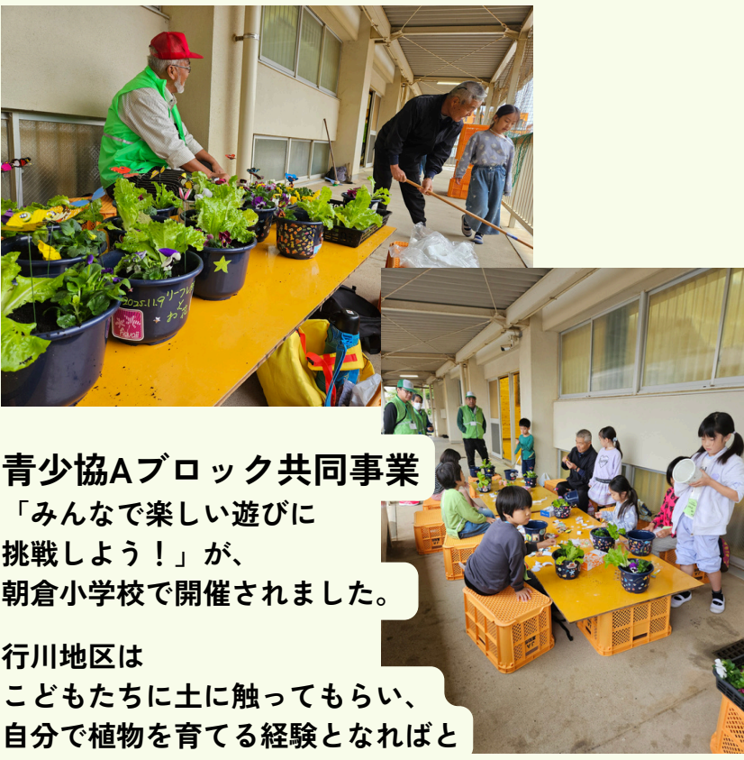
青少協Aブロック共同事業「みんなで楽しい遊びに挑戦しよう！」が、朝倉小学校で開催されました。