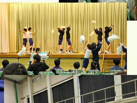
謡いの唄や踊りの足さばきなど、さまざまな研究がされていました。