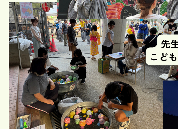
先生方とPTAによる こどもたちへの縁日！