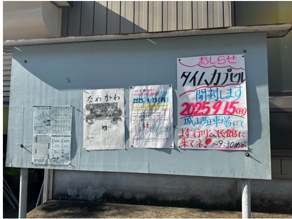
カプセルを封じた当時の写真を展示。