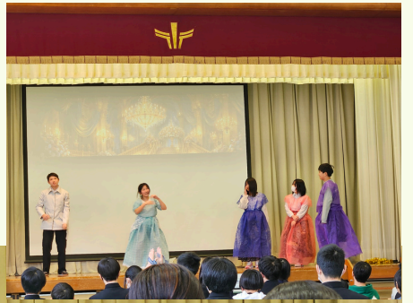
卒業生を送る会が、今年も行われました。一年生から八年生までさまざまな趣向を凝らして生き生きとした、とても素敵な出し物の数々で、卒業生へエールを送ってくれました。