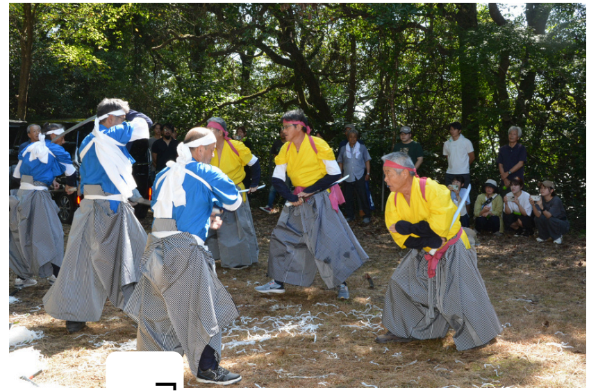
「うわっ！懐かしい」の音が響きました。

二〇年前、二〇〇五年に封じられたタイムカプセルが、九月一五日に開封されました。行川保育園、小学校、中学校の当時の生徒のみなさんや、先生方、関係者のみなさんもお勢集まってくれました。タイムカプセルの中身は、行川地区公民館1階に展示されています。