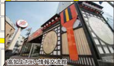
高知よざい情報交流館