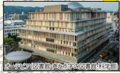
オーゼピア(図書館と点字の図書館・科学館)