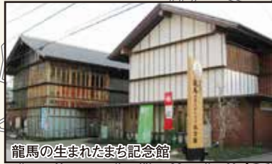
龍馬の生まれたまち記念館