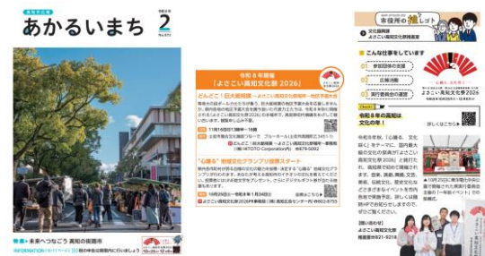
2月号表紙 11月号 12月号

県実行委員会が実施するイベント情報等を高知市ホームページや広報紙に掲載したほか、高知市公式LINEからも情報発信を行うなど幅広く周知を図った。また、本庁舎内に設置されているデジタルサイネージや、こうち観光ナビ・ツーリストセンター (@帯屋町商店街) 前モニターにおいて、県実行委員会が制作したよさこい高知文化祭2026 PR動画上映を行っている。