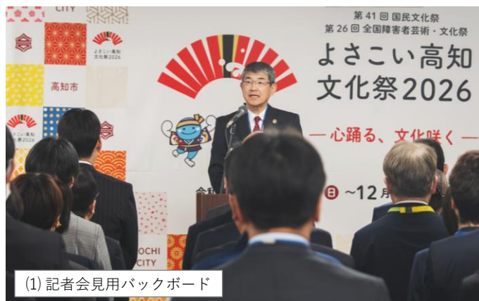
(1) 記者会見用バックボード

令和8年1月13日（火）に高知市役所本庁舎吹き抜け（待合スペース）にPR横断幕を掲示。併せて、よさこい高知文化祭2026応援事業に位置付けて、プロのアーティストと県内外の子どもたちが共同制作したアート作品や、広報パネルを本庁舎エントランスホールに展示（1月13日～2月12日）し、機運醸成を図った。なお、PR横断幕は会期終了まで掲示予定。