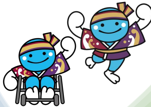
よさこい高知文化祭2026 マスコットキャラクター くろしおくん