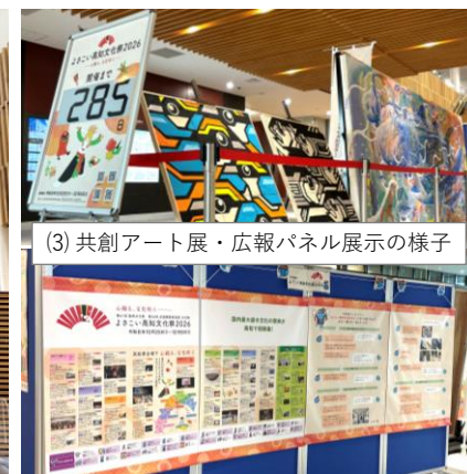
(3) 共創アート展・広報パネル展示の様子