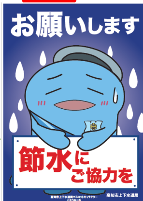
高知市上下水道局マスコットキャラクター とさうおっち