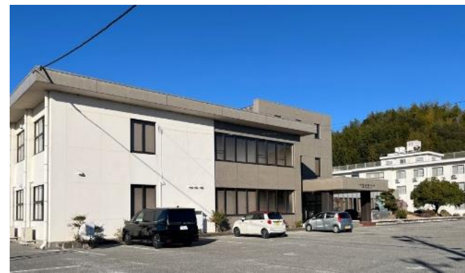
J A教育研修センター 外観

CHECK! 2月10日、登録第1号のJ A教育研修センターにおいて、登録証交付式を開催します！