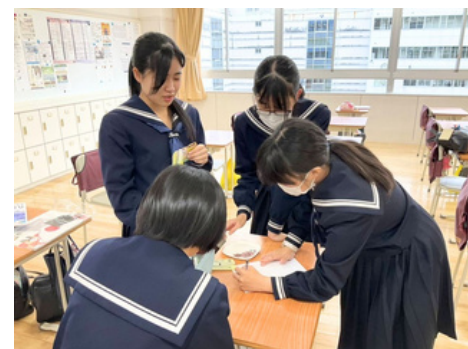
▲お菓子試食の様子