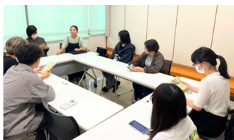
▲アドバイザーサークル定例会の様子