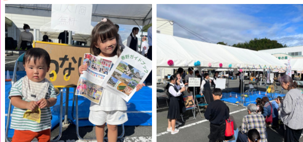
▲ハルピア祭り出展の様子

10月26日（日）のハルピア祭りでは、輪投げやビンゴブースを出展し、ブースからはみ出るほどのたくさんのこどもたちに楽しんでもらえました！