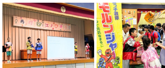
▲江ノ口まつりの様子▲