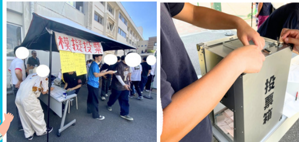
▲模擬投票イベントの様子