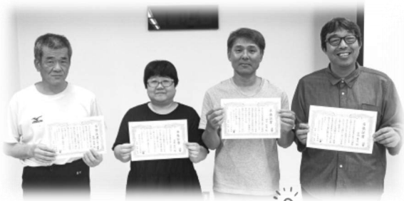
今回卒塾した4名の卒塾証書

今回は 4名 の方が卒塾となり、卒塾式では、各々に内容の違う 卒塾証書 が授与されました！！