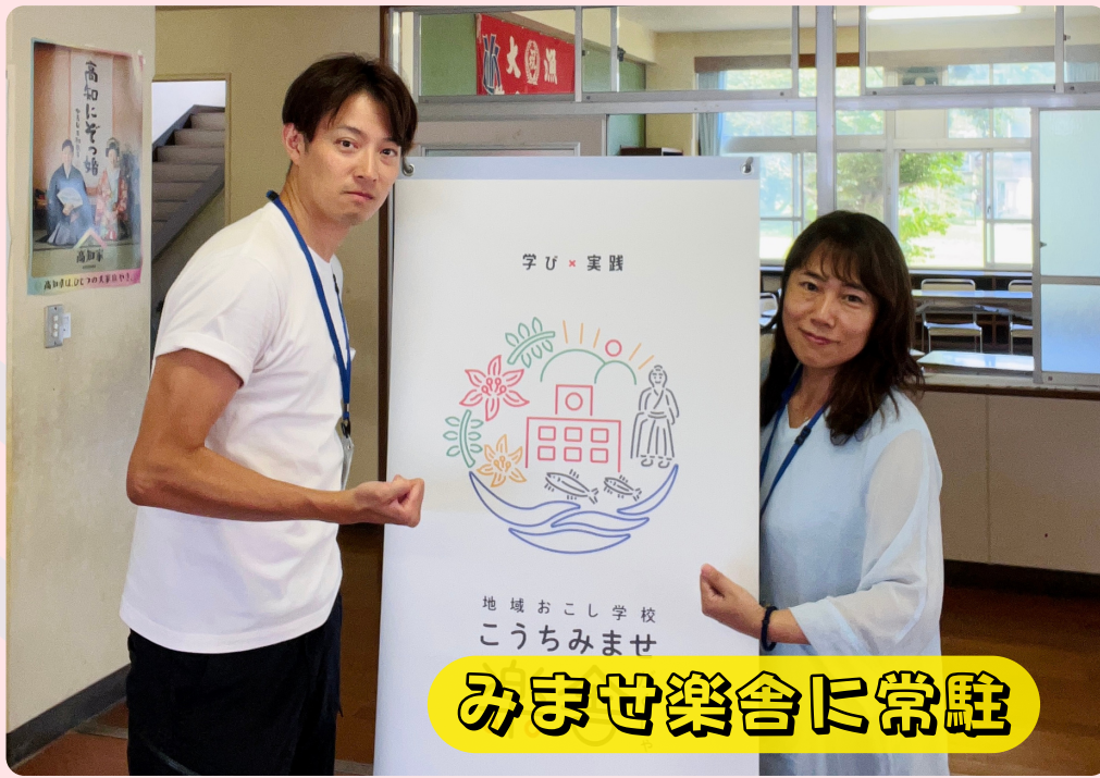
みませ楽舎に常駐