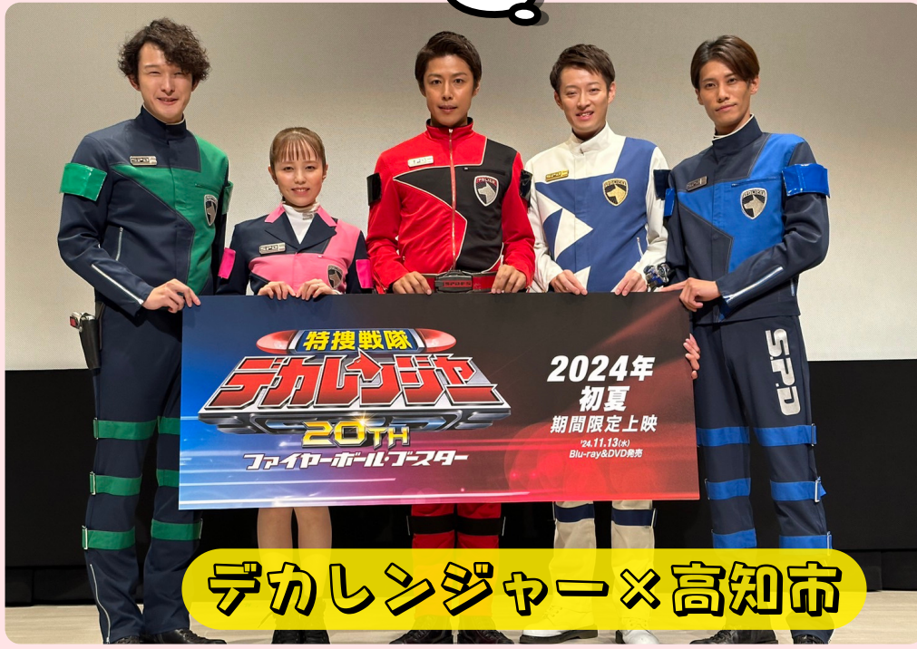
デカレンジャー×高知市