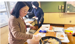
お弁当の具材にしたいメヒカリを調理