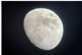
天体望遠鏡で見た月に感動！