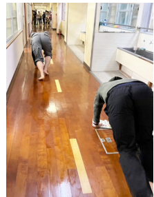
白熱！廊下拭きタイムレース

12月は、旧御豊瀬小学校の大掃除にあわせ、雑巾を両手に「廊下拭きタイムレース」を開催！ 校舎内をみんなで楽しく掃除をした後は、焼き芋大会です。地域の方から提供いただいたお芋を美味しくいただき、子どもからお年寄りまで楽しめた教室となりました。