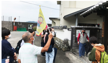
ガイドさんのように旗を振って案内「ハイ、次行くよ～！」