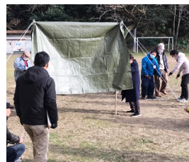
学んだロープワークを用いて力を合わせてタープ張り！

聞き慣れない言葉に、戸惑いながらスタートした教室でしたが、授業が進むにつれて受講生がレベルアップ！ 1回目にはできなかったファシリテーションを、最終回の成果発表会では、場場の見学者を巻き込んで実践。進行役を務めたグループトークは大盛り上がりで、笑顔あふれる時間となりました。 見事にこなしたファシリテーター、大成功！