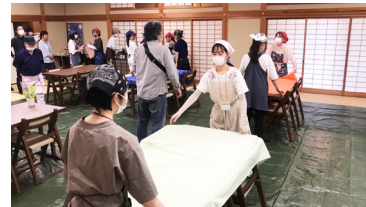
若宮八幡宮で、こども食堂のお手伝い