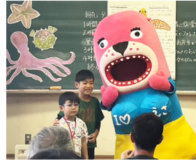
教室におとどちゃんがやってきた！

高知大学ウミガメサークル「かめイズム」とコラボし、旧御豊瀬小学校内に1日限りのミニ水族館をオープン！当日はくろしおくんやおとどちゃんも来てくれました。一緒に漁港周辺のゴミ拾いをし、拾った廃材を活用してフォトフレームを作成。また、地域の方を講師に招き、地域の水産業などについて語っていただきました。 みませ楽舎を通じて、地域のことや海の生き物について、楽しく学ぶことができました。