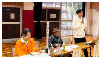
コメンテーターから発表に対して講評