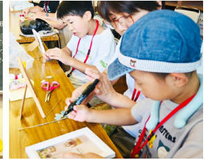
フォトフレーム作りに夢中