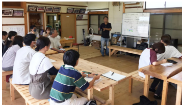
地域の方がDIYで作った椅子と机を使って、拠点の活用策を考える