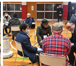
ファシリテーション技術を生かしグループトークを進行