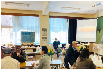
教室がカフェに変わり大盛況