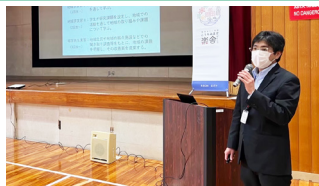
実行の前に企画や想いを発表