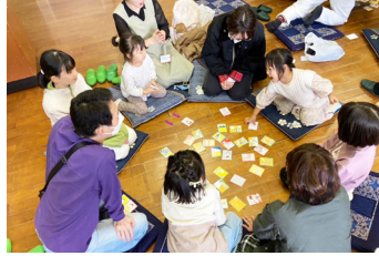
オリジナルかるたで大盛り上がり