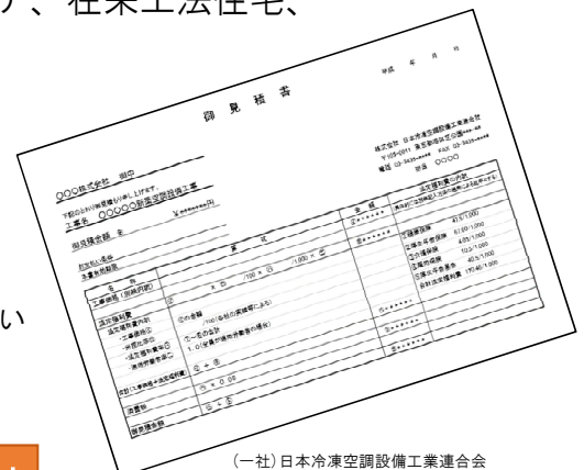
(一社)日本冷凍空調設備工業連合会