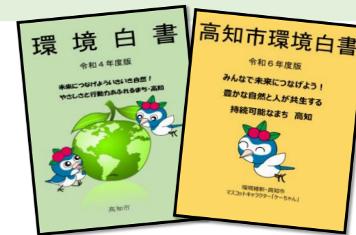
第二次高知市環境基本計画 【計画期間：2013（平成25）年度～2022（平成34）年度】