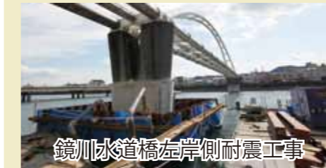
鏡川水道橋左岸側耐震工事

かるぼ一との南の鏡川にかかる鏡川水道橋は、高知市の約3割の水道水が流れる基幹施設です。平成21年5月に完了している右岸側の耐震工事に続き、現在左岸側を工事中で、平成24年5月に耐震化が完了する予定です。