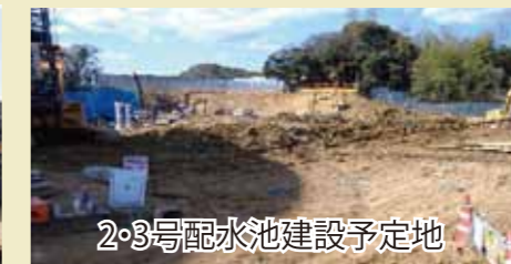
2・3号配水池建設予定地

平成28年度更新完了を目指し更新工事中の旭浄水場。新1号配水池で給水を続けながら、残る2・3号配水池を平成25年3月の完成をめざし現在同時に更新中です。鏡川廊中堰北にある鏡川第1取水所から旭浄水場間の導水管の布設替は、平成24年度中の完成を目指し、ミニシールド工法で工事中です。なお、最終段階の浄水処理施設更新工事着工は平成25年度の予定です。