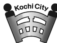
【にじいろのまち シンボルマーク】

令和2年11月、高知市は、一人ひとりの性のあり方が尊重され、誰もがそれぞれの個性や生き方をお互いに認め合い支え合う「にじいろのまち」をめざして、積極的に取り組んでいくことを宣言しました。