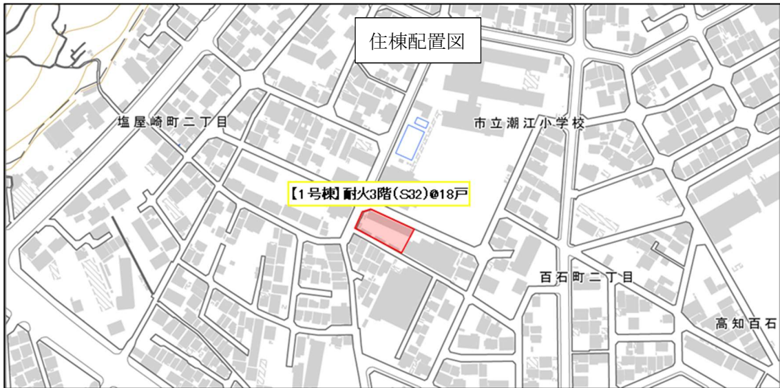
国土地理院基盤地図情報に情報を追加し作成