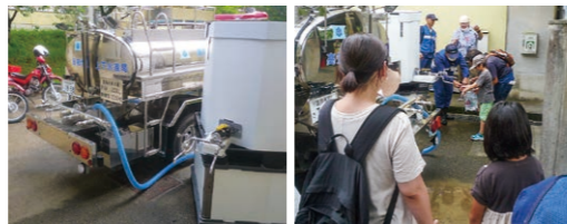
※令和5年7月9日横浜新町小学校で行われた防災訓練での仮設給水タンクからの応急給水訓練の様子

そのような場合に「いのちの水」をできるだけ早く供給できるよう、自主防災組織等と、応急給水訓練を行っています。