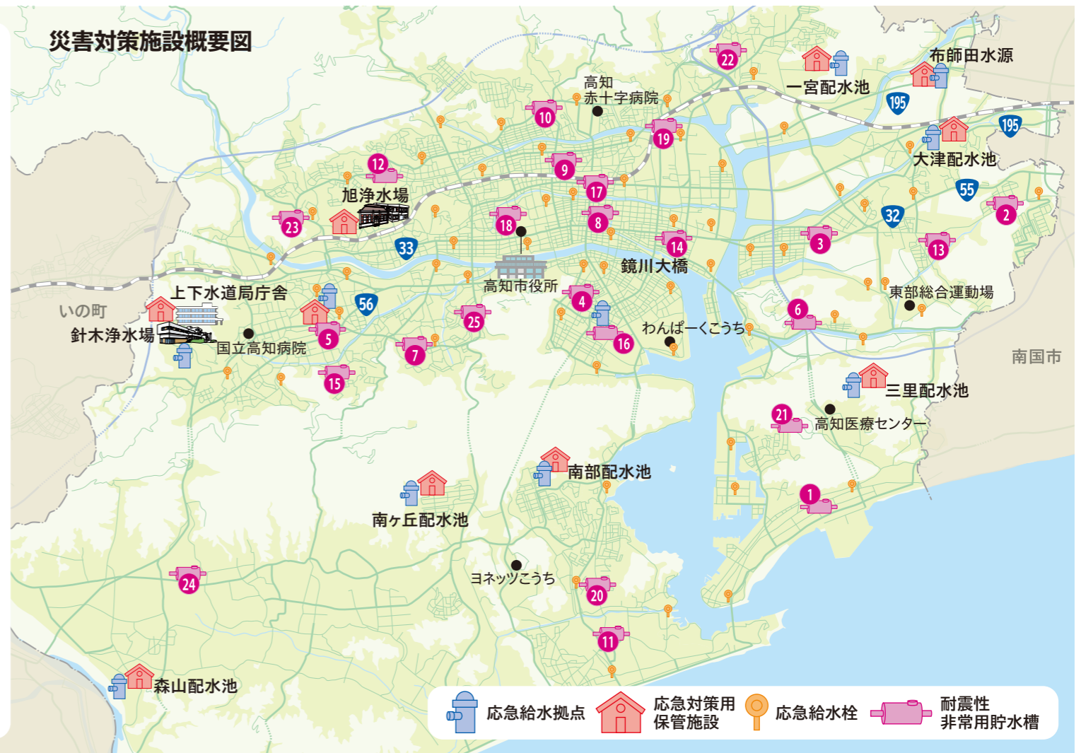
応急給水拠点 応急対策用保管施設 応急給水栓 耐震性非常用貯水槽