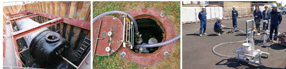
耐震性非常用貯水槽(本体)

耐震性非常用貯水槽は、災害で水道管が寸断され断水となった場合でも、貯水槽の上部の給水口からポンプによりタンク内の水を供給できるもので、1基あたり1人1日3ℓ計算で、6,000人が3日間使用可能な量の水を貯水しています。