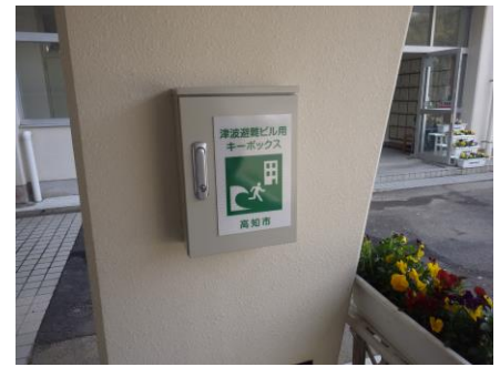
自動解錠装置付キーボックス