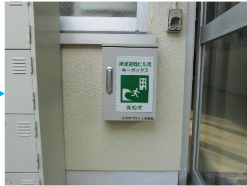
自動解錠装置付キーボックス