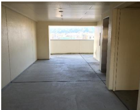
コミュニティスペース