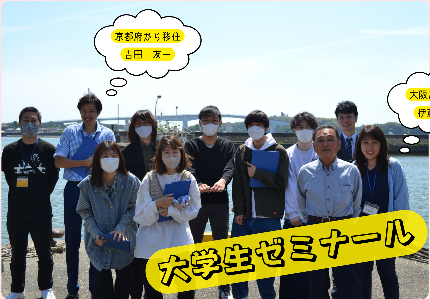
高知県立大学のゼミ生と御畳瀬漁港で記念撮影

高知市地域おこし協力隊の活動内容についてご紹介♪ ミッションは「長浜・御畳瀬・浦戸地域の活性化！」