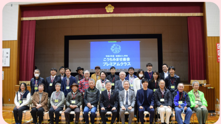
プレミアムクラス修了

2022年7月に第1回の授業がスタートした、みませ楽舎「プレミアムクラス」。全7回という長丁場、自分のやりたいにむき合い、最終回の「大プレゼン大会」で、これからの行動を宣言した受講生の皆さん！発表後に全員で記念撮影♪