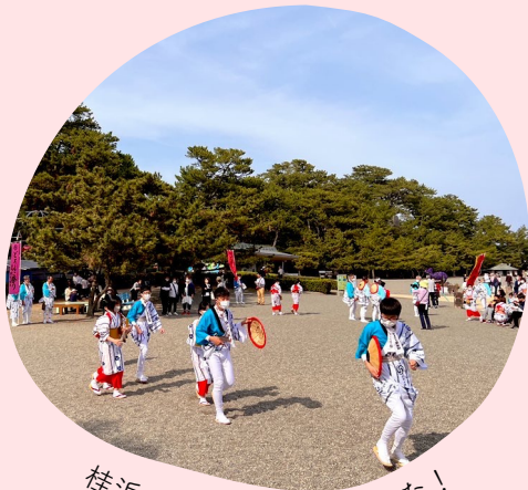
桂浜で踊りを披露しました！

2022年7月に第1回の授業がスタートした、みませ楽舎「プレミアムクラス」。全7回という長丁場、自分のやりたいにむき合い、最終回の「大プレゼン大会」で、これからの行動を宣言した受講生の皆さん！発表後に全員で記念撮影♪