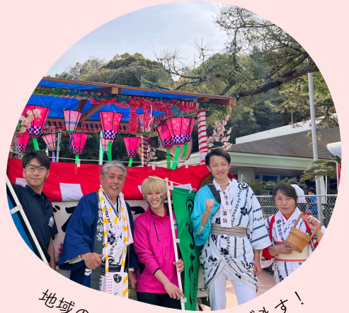
地域の方と一緒に盛り上げます！