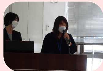
②まちづくり未来塾

①「こうちみませ楽舎」成果発表会のあとに、歳末たすけあい大そうじ&焼き芋交流会を行いました。サツマイモの調達やドラム缶探しなど、たくさんのご協力をいただきました。