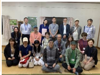
ホタル学習会の後にみんなで♪📷

この時期にしか観ることができないゲンジボタルを観賞でき、貴重な経験をした参加者の皆さんも大満足の移住者交流会となりました。来年も開催できたらいいなと思っています♪