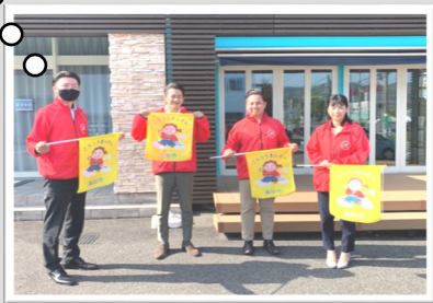
▲「(株)建匠」の活動のようす