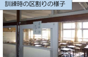
訓練時の区割りの様子