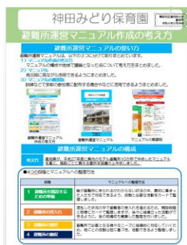
避難所運営マニュアル 作成の考え方