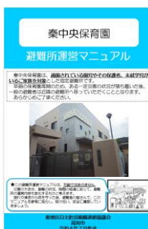
避難所運営マニュアル