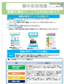
避難所運営マニュアル 作成の考え方