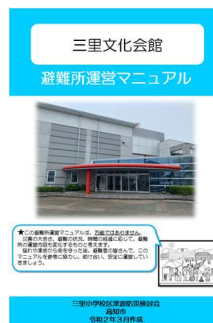
避難所運営マニュアル