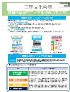
避難所運営マニュアル 作成の考え方