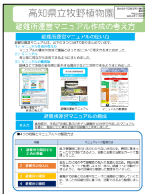
避難所運営マニュアル 作成の考え方