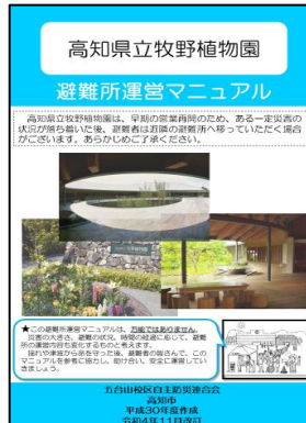
避難所運営マニュアル