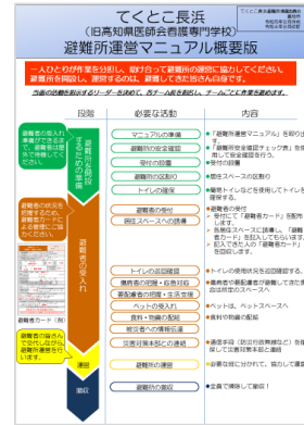
マニュアルの概要版