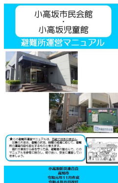
避難所運営マニュアル