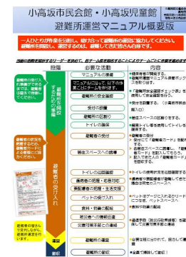
マニュアルの概要版