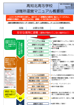
マニュアルの概要版