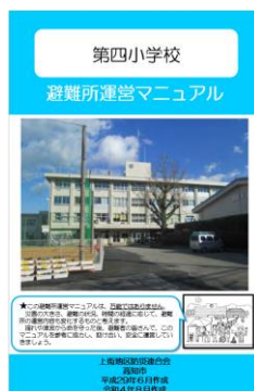
避難所運営マニュアル