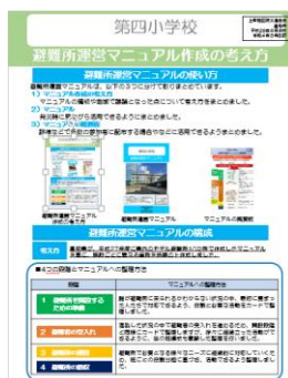
避難所運営マニュアル 作成の考え方