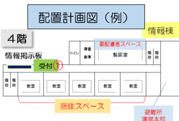
訓練時の区割りの様子