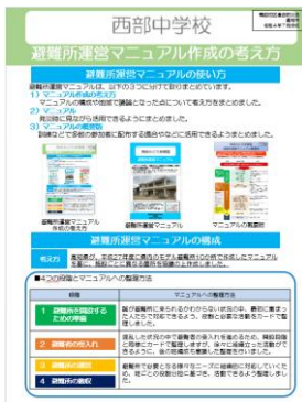
避難所運営マニュアル 作成の考え方