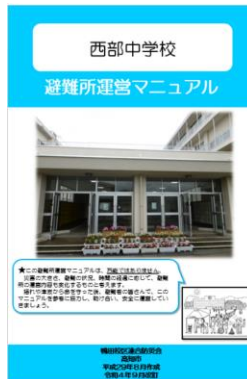
避難所運営マニュアル