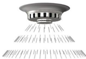
スプリンクラー設備