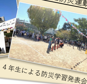
4年生による防災学習発表会