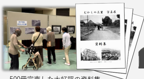
50冊完売した大好評の資料集