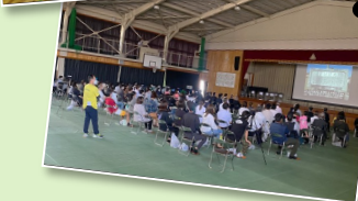
介良の歴史スライドショー