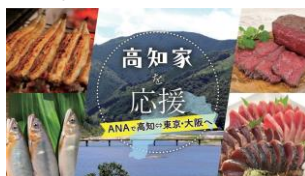
ANAに乗って「高知家」応援キャンペーン!