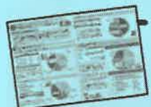
潮江南 地域アンケート

潮江南地域では令和2年度から潮江南地域のコミュニティ計画の策定に取り組んでいます。新型コロナウイルスの感染拡大の影響により、一定期間会議を開催できませんでしたが、これからも地域が丸となって、「みんながハッピーで笑顔あふれる未来のまち」を考えていきます。