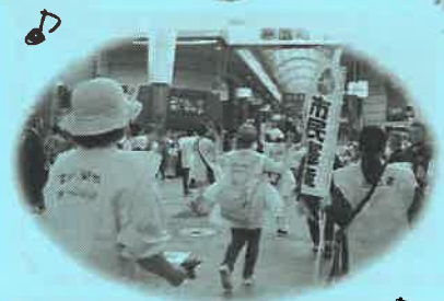
岡崎市長も見事な踊りでした!