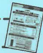
子ども版 コミュニティ計画の作成