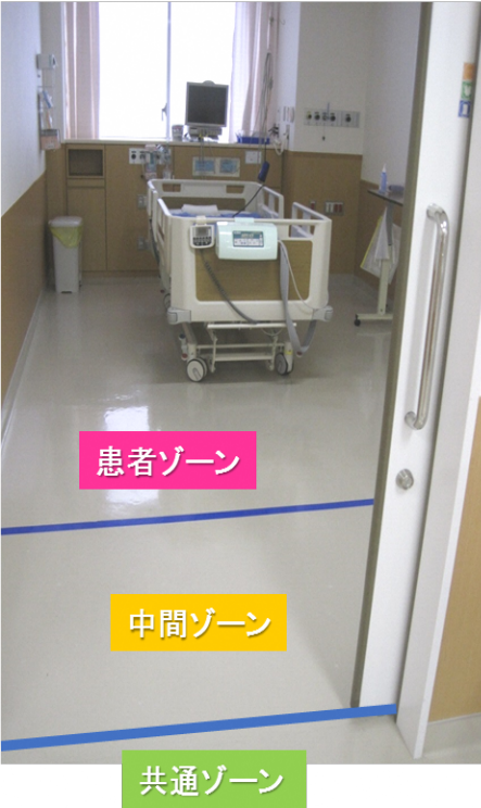
病室ゾーニングの1例