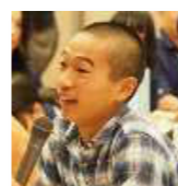
第3期こども審査員 高知中央高等学校2年生 (写真当時)