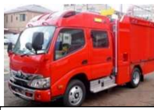
水槽付消防ポンプ自動車