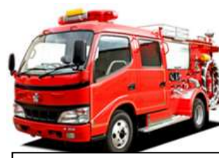
非常備消防ポンプ自動車