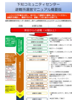
マニュアルの概要版