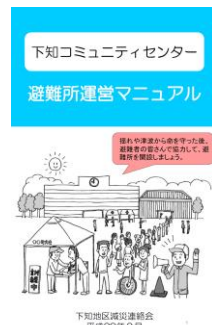
避難所運営マニュアル