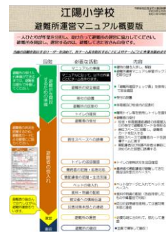
マニュアルの概要版