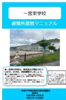
避難所運営マニュアル