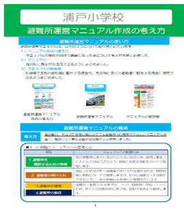
避難所運営マニュアル 作成の考え方

訓練などで多数の参加者に配布する場合や、発災時に多くの避難者に配布する場合に活用できるようまとめました。