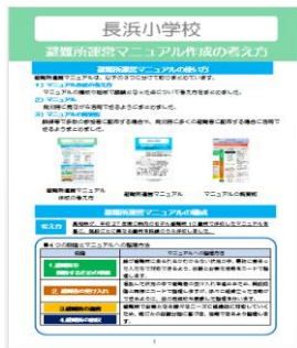
避難所運営マニュアル 作成の考え方

訓練などで多数の参加者に配布する場合や、発災時に多くの避難者に配布する場合に活用できるようまとめました。