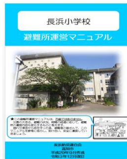
避難所運営マニュアル