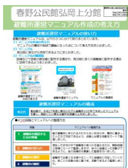
避難所運営マニュアル 作成の考え方

訓練などで多数の参加者に配布する場合や、発災時に多くの避難者に配布する場合に活用できるようまとめました。