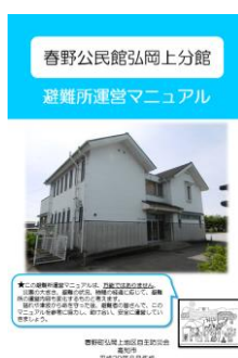
避難所運営マニュアル