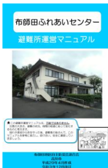
避難所運営マニュアル