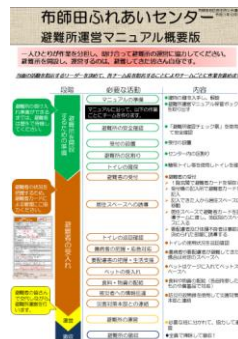
マニュアルの概要版